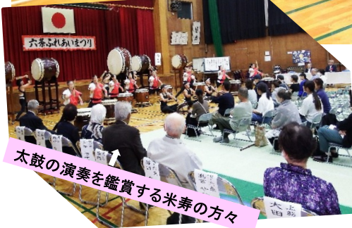
太鼓の演奏を鑑賞する米寿の方々