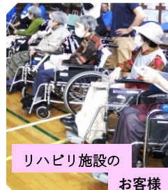
リハビリ施設の お客様