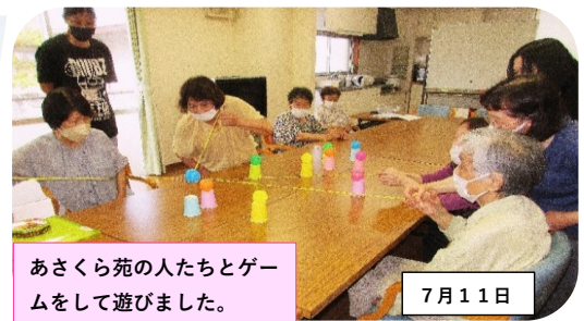
あさくら苑の人たちとゲームをして遊びました。 7月11日

ふれあいサロンで「介護予防教室」を開きました。 はやねっと東足羽、厚生病院、リハビリセンターの人たちのご講義や 脳トレ、体操などを教えてもらいました。 7月3日