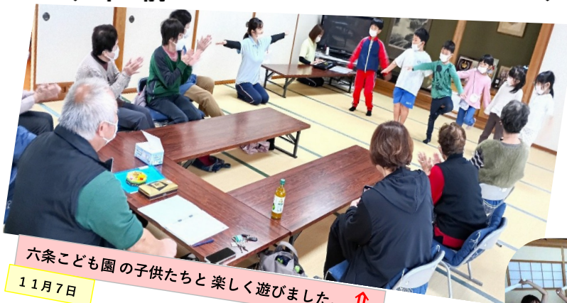
六条こども園の子供たちと楽しく遊びました。↑ 11月7日