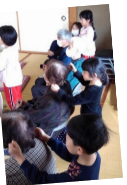
肩たたき インタビュー