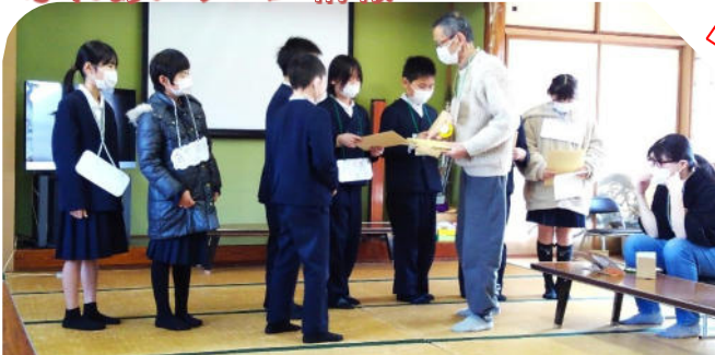
四年生の福祉学習 上筋生田町