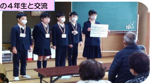
学校での学習や遊びの様子を聞き、玉入れなどのゲームをして楽しみました。児童の手作りの「風船だるま」をもらいました。