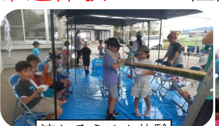
流しそうめん体験