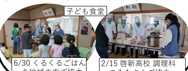
6/30 くるくるごはん & 地域の方ご協力