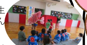
大人気! あっぷちゃん