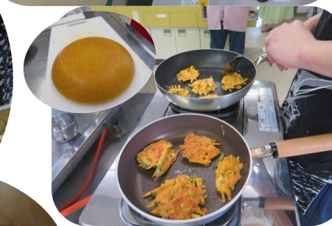
・米粉のガレット 5/30 ・米粉のにんじんケーキ