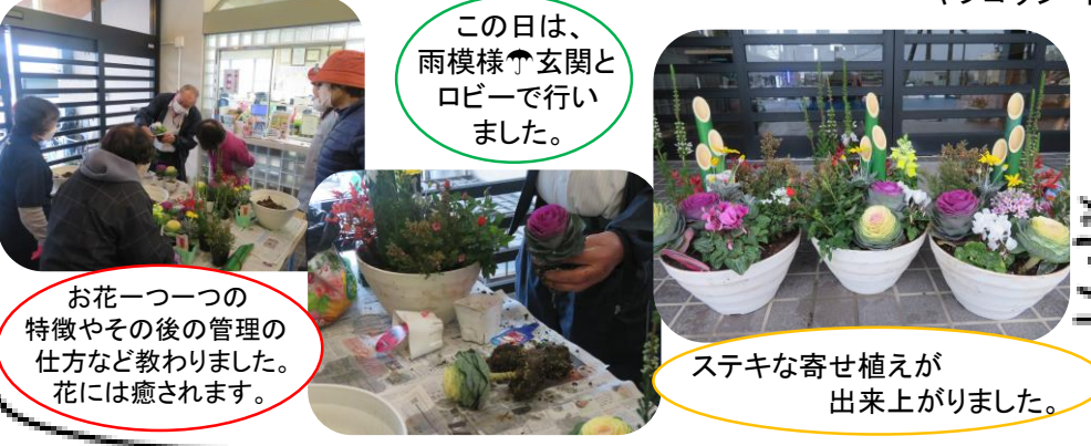
お花一つ一つの特徴やその後の管理の仕方など教わりました。花には癒されます。