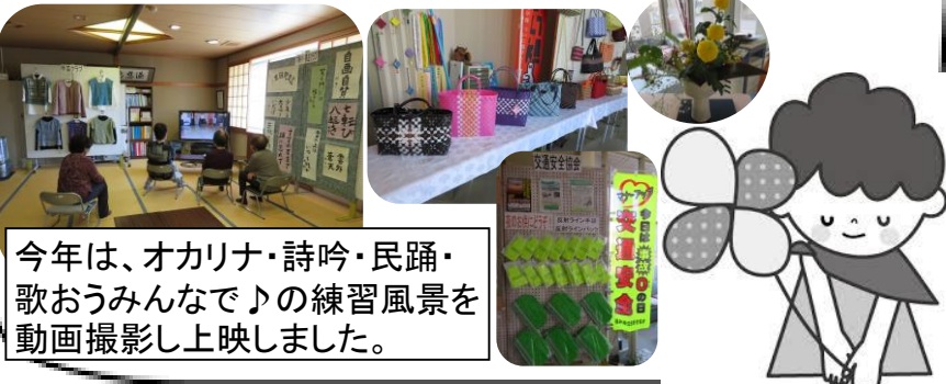
今年は、オカリナ・詩吟・民謡・歌おうみんなでの練習風景を動画撮影し上映しました。

10/29(土)～11/6(日)の間、公民館1階でミニ文化祭を行いました。自主グループの活動紹介や作品など、展示や動画撮影にご協力いただき、ありがとうございました。